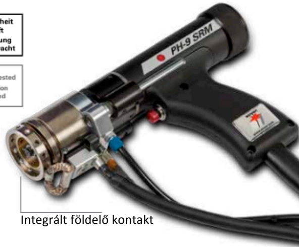
Integrált földelő kontakt